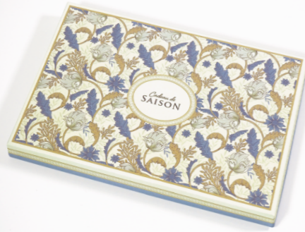
11. モリス (ブルー)