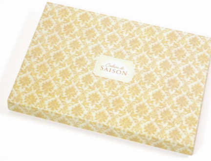
03. ゴールドダマスク