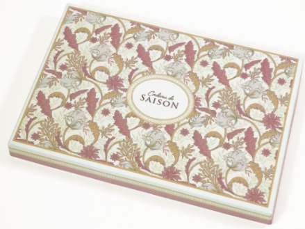
10. モリス (ピンク)