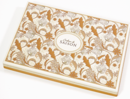
09. モリス (プレーン)