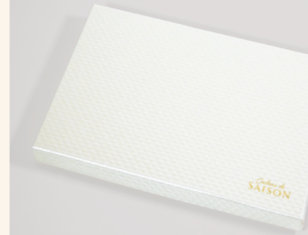
01. ミリオンホワイト

ご希望の紙・箔押の色デザインをお選びください。 ※プレミアム送料 BOX は別途箔版代 ¥6000 が初回制作時かかります。