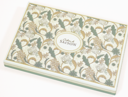
12. モリス (グリーン)