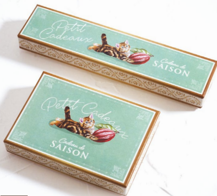
5 ガトーキャット・グリーン