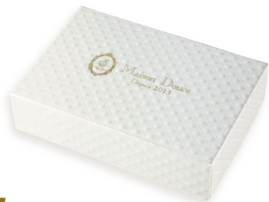
1 ミリオンホワイト

チラシ裏面の Step A より、箱の形状をお選び頂き、お好きな紙をお選び下さい。