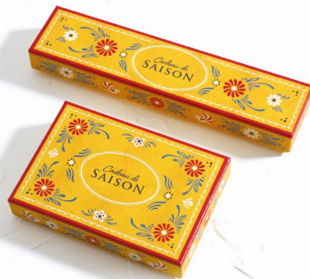
9 アルザス・イエロー