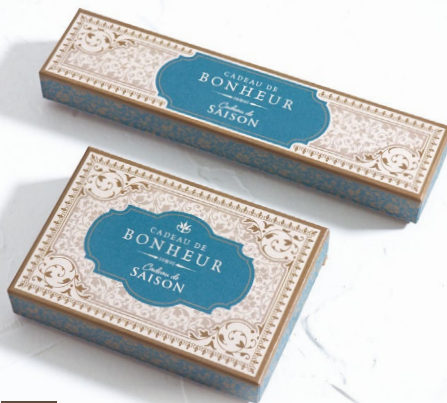
2 メルベユ・ブルー