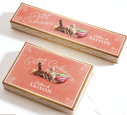
4 ガトーキャット・サーモンピンク