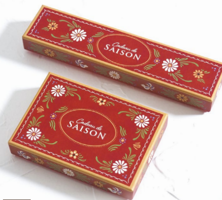
6 アルザス・レッド