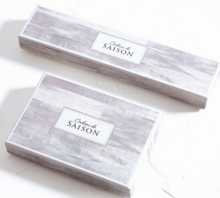
8 ウッド ホワイト