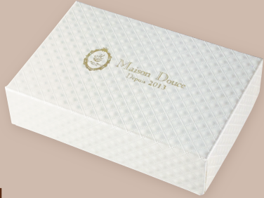
1 ミリオンホワイト

チラシ裏面の Step1 より、箱の形状をお選び頂き、お好きな紙をお選び下さい。